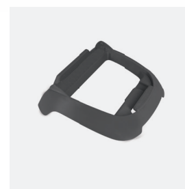
Socle pour boîtier de commande