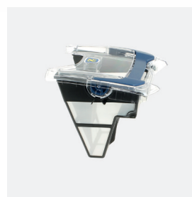
Bac filtrant (3L) débris fins 100 microns